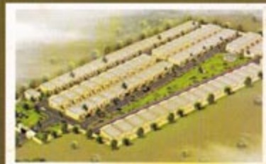
Vrindavan Colony, Bhatapara