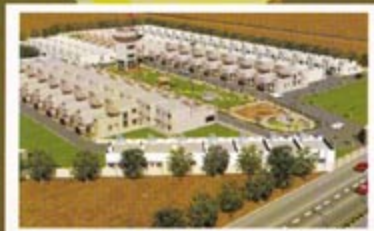
Shree Krishna Nagar, Tilda