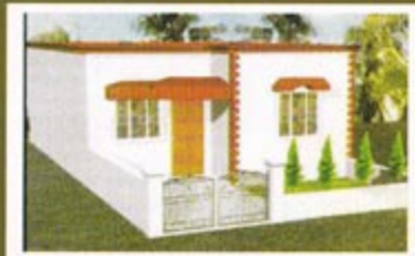
Shree Krishna Nagar, Bhatapara