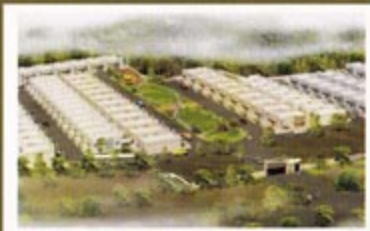
Shree Krishna Nagar, Baloda Bazaar